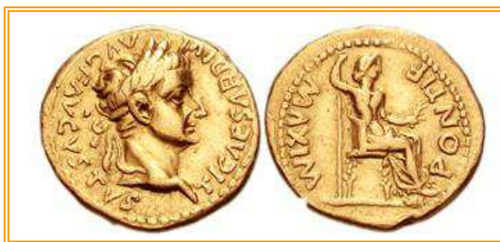
Moneta d'oro raffigurante Tiberio Claudio Nerone e la madre Livia Drusilla

Ci mettiamo alla Presenza del Signore, per vivere questa Eucaristia, che prepara anche quella successiva, dove 71 persone riceveranno il Sacramento della Cresima; la Chiesa, quindi sarà riempita di Spirito Santo, che nella seconda lettura viene chiamato "dinamite" (energeia/dynamis).